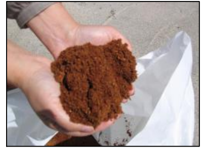
アミノ酸20種類と 特異的金属イオン15種類を持った 家庭用生ゴミ処理母材

生ゴミを分解する微生物が、自然に発生し、上手に育って行く環境を作り出す機能を持っており、これが 高効率で生ゴミを分解 する事ができる秘密です。