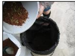
搅拌した生ゴミを 袋へ投入