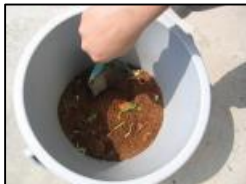
生ゴミと母材を バケツで搅拌