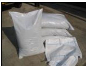
土嚢袋セット 600~700g/日用