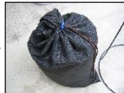
一杯になったら 次の袋へ