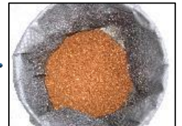
約1ヶ月で堆肥化完了 母材として再利用

生ゴミが毎日600~700gの出る一般的なご家庭の場合、1袋はおおむね1週間で満タンになります。分解には、約1ヶ月要しますので4袋出来上がります。5袋目からは、一番最初の袋を母材として循環使用します。