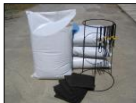
不織布袋セット 600~700g/日用